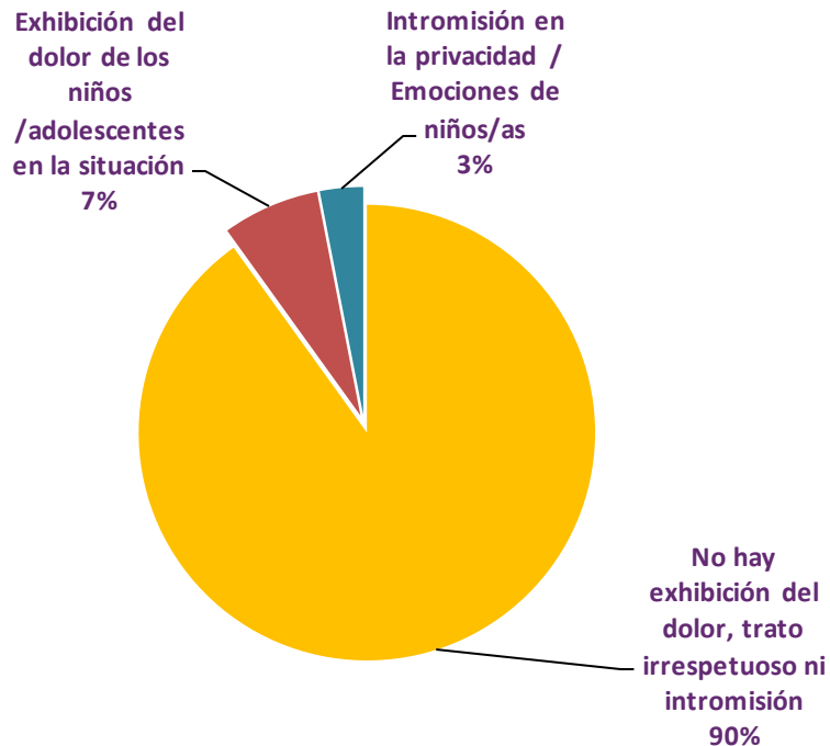
% Unidades según uso de niños/as como recurso dramático