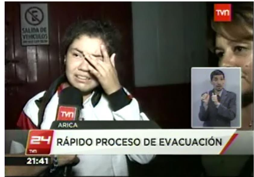
Fuente: Nota de prensa, 24 Horas Central, 2 abril, TVN