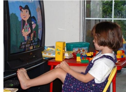
"Watching TV" by oddharmonic. Licensed with CC BY-SA 2.0.

Todo esto ocurre en el contexto de emergencia impuesto por la pandemia: medidas de confinamiento, asociadas a un mayor consumo audiovisual en los hogares.