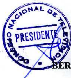
BERNARDO DONOSO RIVEROS Presidente Consejo Nacional de Televisión

ANOTESE, TOMESE RAZON Y COMUNIQUESE AL INTERESADO.