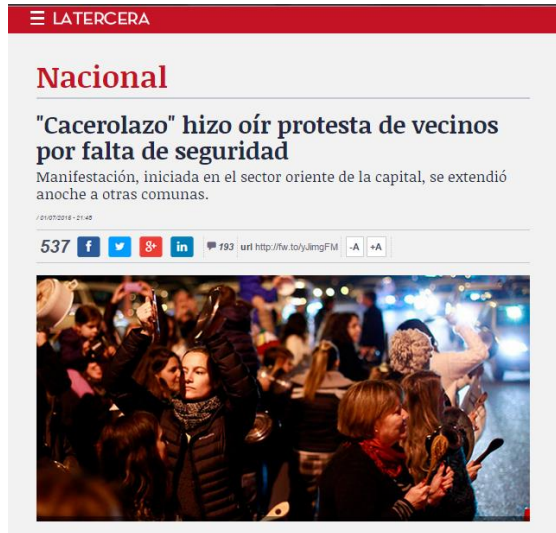
Fig.: 1

conjunta de los vecinos quienes, cansados de estos episodios, se pronunciaron de manera pública sobre la sensación de inseguridad en la que viven: