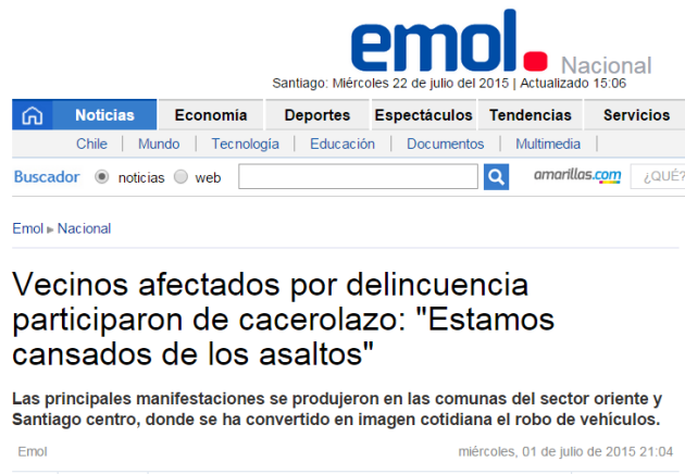
Fig. 2